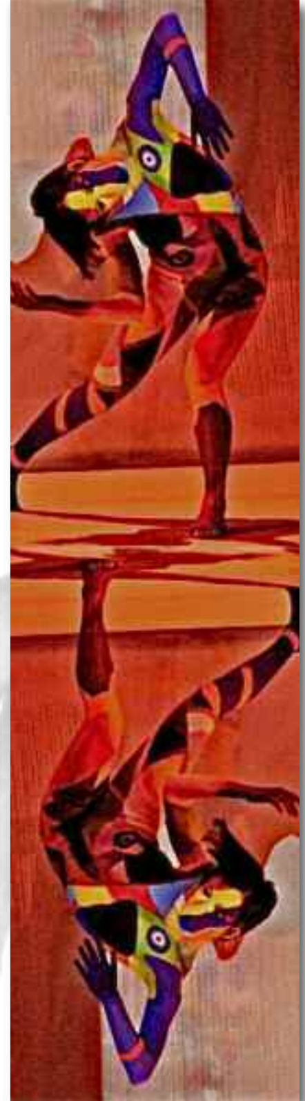
artwork: LUCA DI PAOLO

Dal 2007 WDA Europe in collaborazione con lo studio grafico PAC Proietti Art Creations sono sponsors e realizzatori del messaggio stesso.