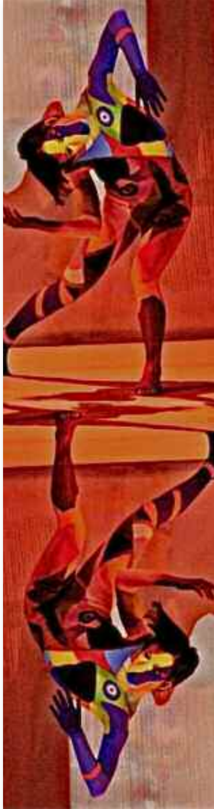
artwork: LUCA DI PAOLO